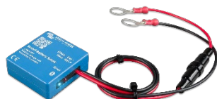
Bluetooth считывание Smart Battery Sense