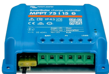
Контроллер заряда SmartSolar MPPT 75/15