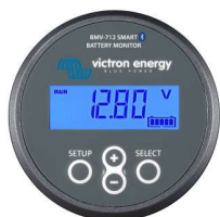
Bluetooth считывание BMV-712 Smart Battery Monitor