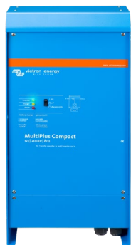
MultiPlus Compact 12/2000/80