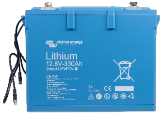
Литий-железо-фосфатная батарея (LiFePO4) 12,8 В, 330 Ач